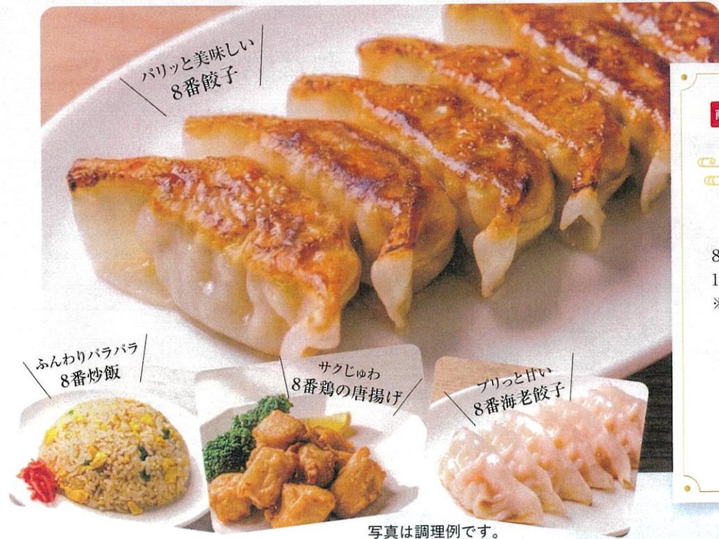
写真は調理例です。